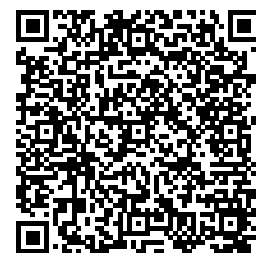
QR Cartillas Guías y Manuales

*La UPME sólo evaluará solicitudes completas