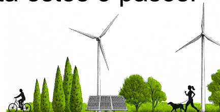
QR Resolución UPME 135 de 2025

2 Una vez cumplidos los requisitos, registra tu solicitud en el aplicativo a través del Sistema Único de Usuarios-SUU sin necesidad de desplazarte y sin intermediarios.