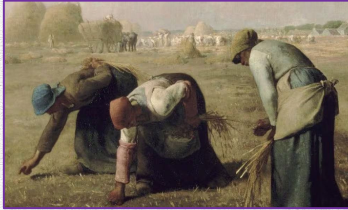
La mujer rural

Declaración de los derechos de la mujer y la ciudadana