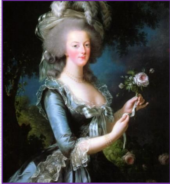
Olympe de Gouges