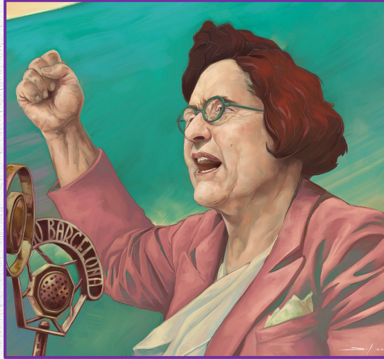
Federica Montseny (1905-1994)

Emancipación de la mujer como la base de una sociedad justa