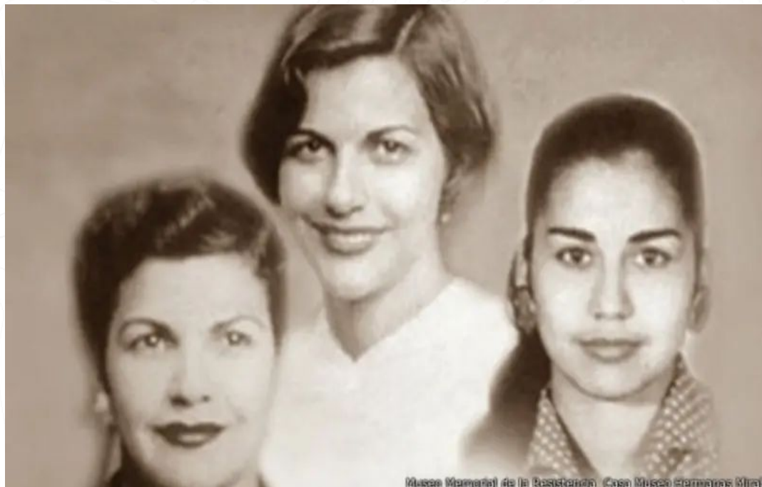
Museo Memorial de la Resistencia Casa Museo Hermanas Miró

Reconocer el origen del 25N, es decir del día de la eliminación de la violencia contra las mujeres y cuestionar la masculinidad patriarcal para desactivarlas en nuestros entorno.