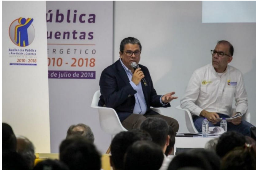
Doctor Germán Arce Ministro de Minas y Energía, socializando logros del sector para el periodo 2010-2018.