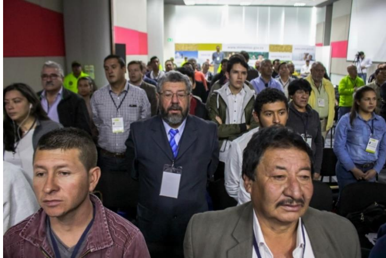
Marco de los asistentes a la Audiencia Pública de Rendición de Cuentas 2010-2018.