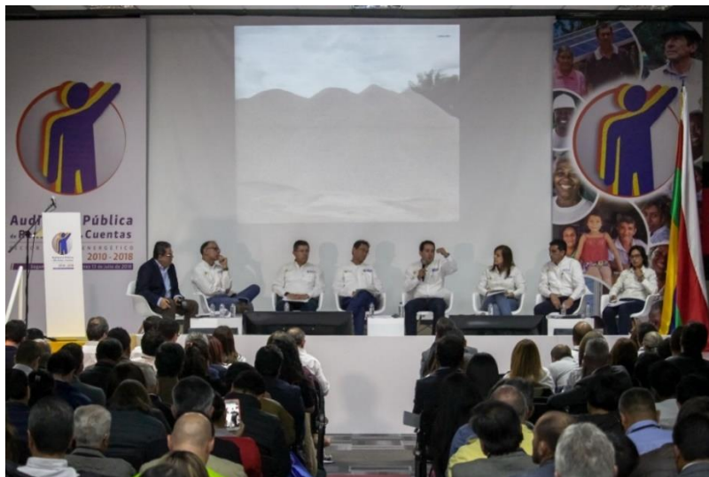
Marco de los panelistas en la Audiencia Pública de Rendición de Cuentas 2010-2018 encabezado por el Ministro de Minas y Energía doctor Germán Arce.