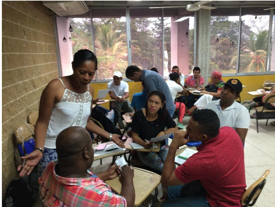
Taller Cartografía Social – Sábado 28 de Octubre 2017