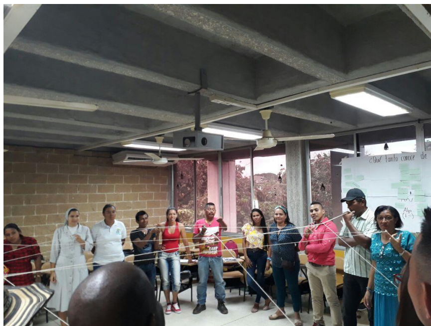
Taller Roles y Competencias de los Actores en el ordenamiento territorial – Viernes 27 Octubre 2017