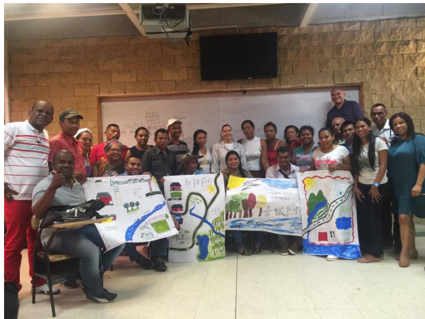
Mapa de Determinantes Ambientales – Domingo 29 Octubre de 2017