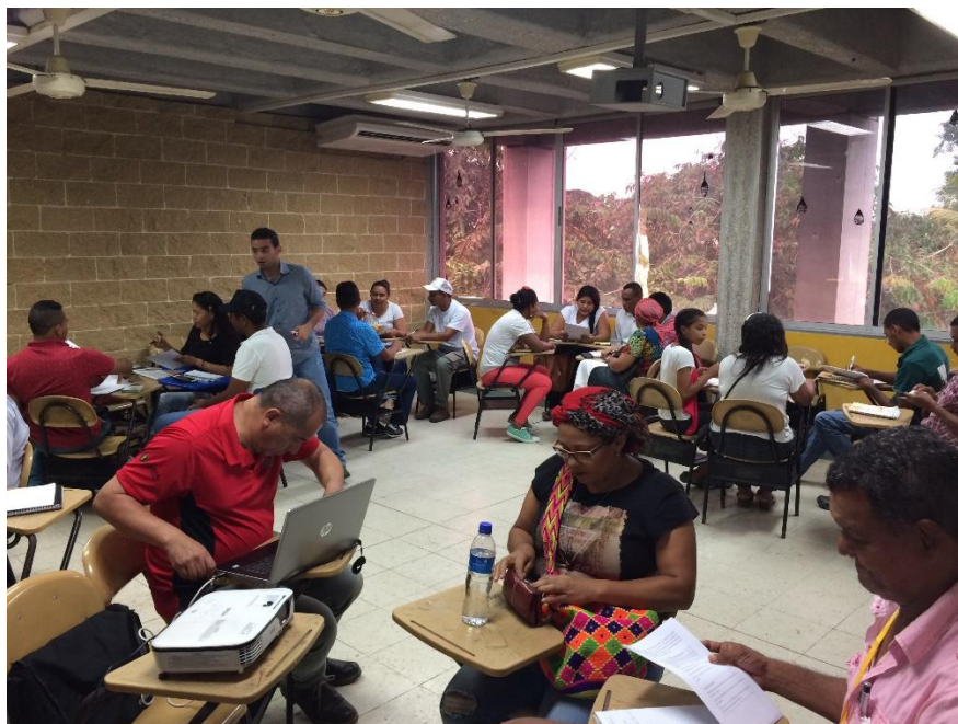
Taller Cartografía Social – Sábado 28 de Octubre 2017